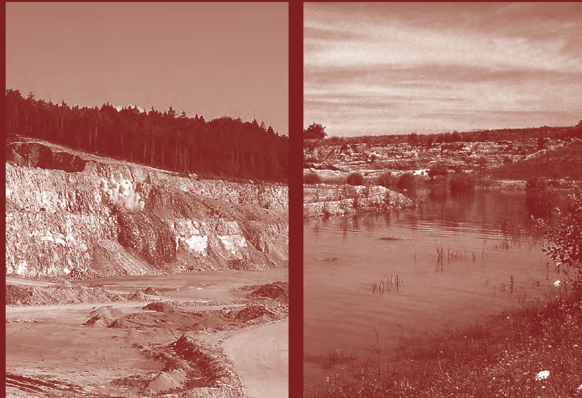
Steinbruch und Kiesgrube. Die zunächst deutlich sichtbaren Eingriffe in Natur und Landschaft können sich nachweislich zu wertvollen Lebensräumen entwickeln.