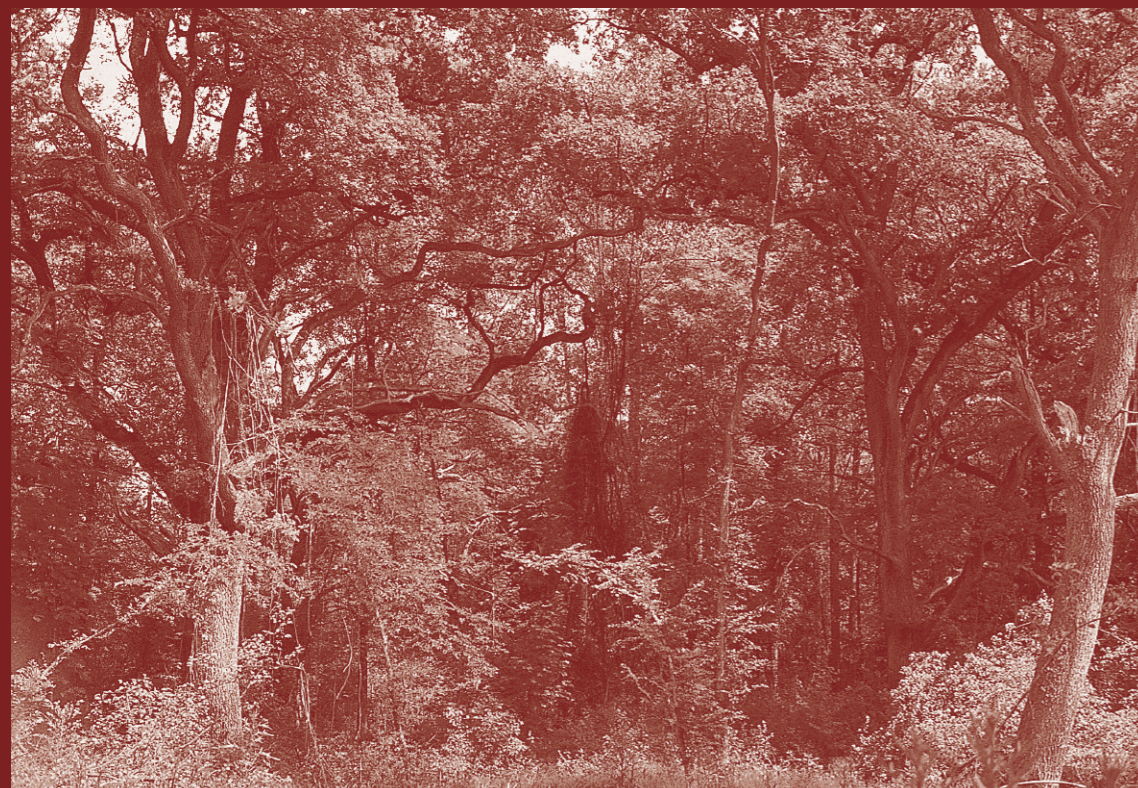
Intakter Auwald am Rhein. In solchen ökologisch herausragenden und zudem gefährdeten Biotopen hat der Naturschutz Vorrang vor der Rohstoffnutzung.