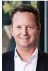
Jörg Strohmeier © Goldbeck

In rasender Geschwindigkeit entstand die Tesla-Fabrik Grünheide. Immerhin erging ein großer Teilauftrag zur Errichtung an das Unternehmen Goldbeck auch durch Elon Musk: Gewissermaßen ein Synonym für Geschwindigkeit. Das auf das elementierte Bauen mit System spezialisierte Familienunternehmen hat Musk in allen Verhandlungen klar fokussiert, schnell entscheidend und absolut konsequent kennengelernt.